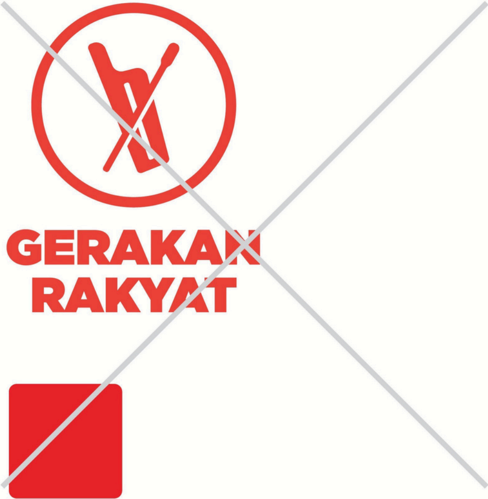
LOGO LAMA GERAKAN RAKYAT