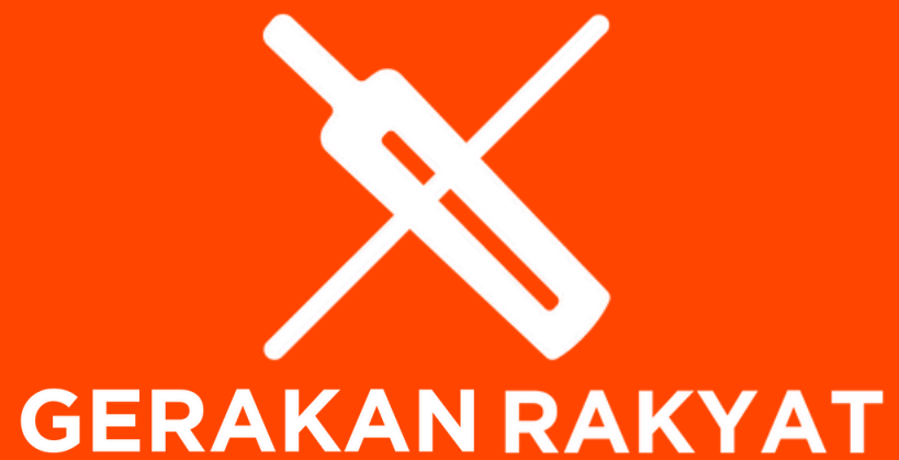
LOGO UTAMA - WARNA PUTIH DI ATAS LATAR JINGGA

Brand atau logo, merupakan aset visual yang berperan sebagai identitas dan media penyampaian komunikasi dalam bentuk citra atau visual. Sangat dibutuhkan konsistensi tampilan visual untuk membuat sebuah nama atau brand mudah dikenal.