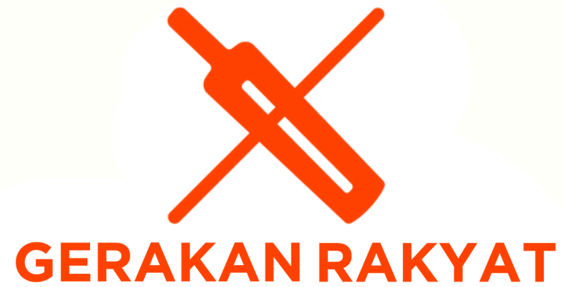
LOGO UTAMA - WARNA JINGGA DI ATAS LATAR PUTIH