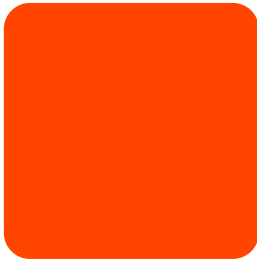
WARNA BARU #FF4500